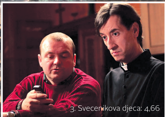
3. Svećenikova djeca: 4,66