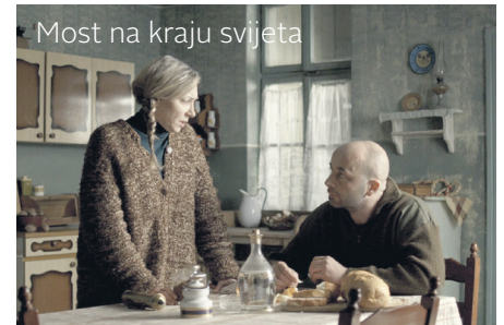
Most na kraju svijeta