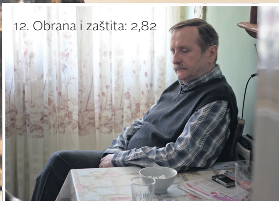
12. Obrana i zaštita: 2,82