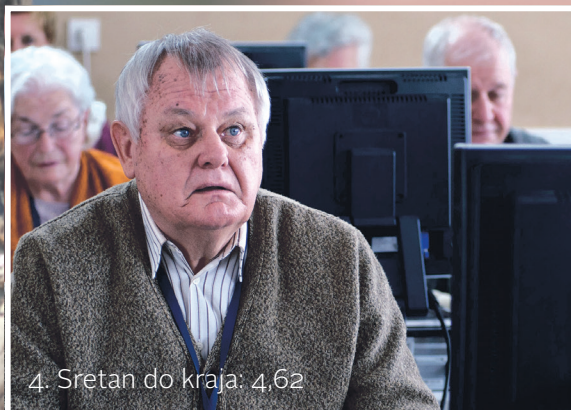
4. Sretan do kraja: 4,62